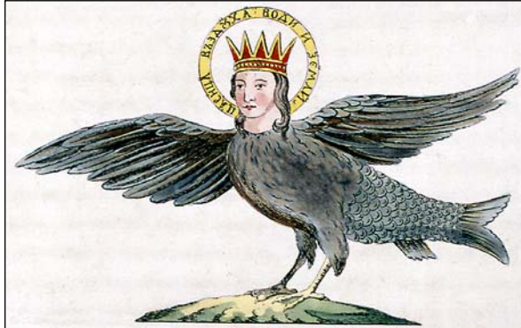
Slika 4: Kraljica elementov Carica vazduha vodi i zemli

gestellt ist, so wie die dreyköpfige Gottheit Triglav der alten Slaven, der man die Herrschaft über Luft, Erde und Wasser zuschrieb« (Hacquet 1801–1808, 1: 11–12).