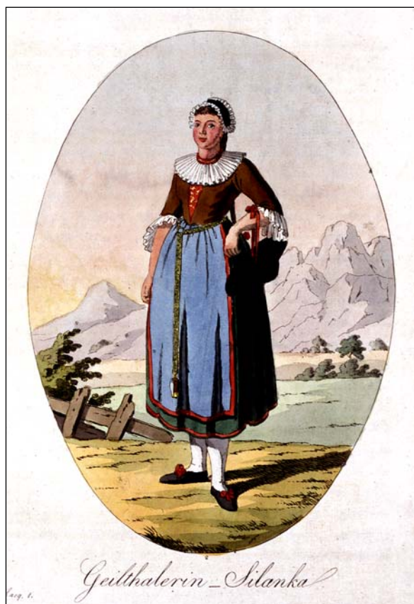
Slika 3: Ziljanke

Vendar se spor med naravo in kulturo–civilizacijo ne ustavi tu. Omeniti velja še en vidik. Gotovo je eden od zelo pomembnih motivov Hacquetovih prizadevanj tudi njegov medicinski poklic, v okviru katerega si Hacquet prizadeva za bolj aktivno razmerje do življenja, do zdravja itd. Tako željo, oblikovati drugačno razmerje do zdravja, je na Slovenskem opaziti veliko kasneje, namreč pri Francetu Malavašiču (1818–1863) in njegovem časniku Pravi Slovenec (1849). Ta želja je v marsičem tipična za zdravnika ali zdravstveno osebje, katerega naloga je prosvetjevati ljudstvo v boju proti boleznim, nečistoči, alkoholu itd. Pri tem se posebej spotakne ob vdanost v usodo, primerljivo s hinduističnim razmerjem do življenja, prisotnim pri veliko ljudem, saj pravi, da ko pride preprosta množica v leta, ne čuti nobenega velikega odpora do smrti (Hacquet 1801–1808, 1: 6).