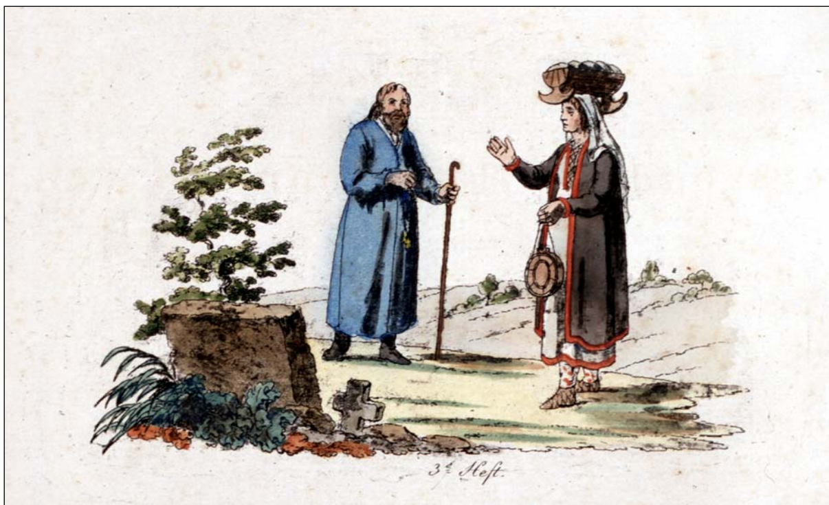
Slika 2: Boter in botra

mann zu früh, um ihm in allen Stücken Hülfe zu leisten « (Hacquet 1801–1808, 2: 72–73).