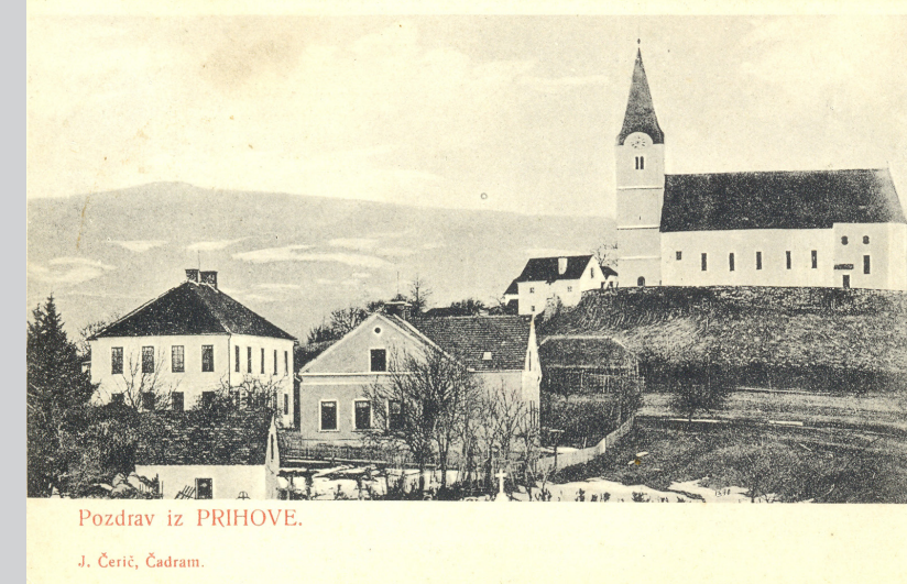
Pozdrav iz PRIHOVE.