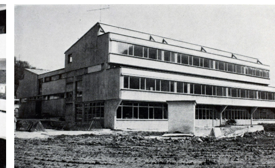
Milka Mirnik, Šola v Poljčanah, vir: Sinteza, 1977

v okviru programa »5 let – 100 šol«, ki je predstavljal nadaljevanje prejšnje akcije. Šlo je za petletni program organizirane gradnje šol ob stoletnici prve obvezne šole v Sloveniji, katerega cilj je bil v letih 1969–1973 zgraditi 100 novih šol. Šola v Poljčanah, ki so jo začeli graditi septembra 1971, je bila dograjena in slovesno odprta 6. januarja 1973.