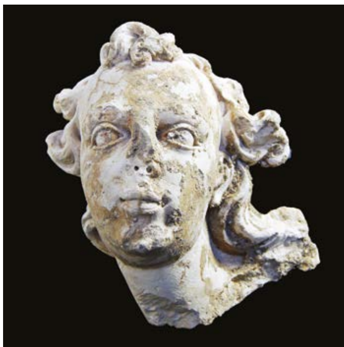
Kamniti glavi z Vojašniškega trga v Mariboru, tretja četrtina 18. stoletja